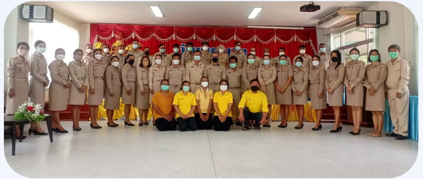
จัดทำโดย งานประชาสัมพันธ์สำนักปลัด เทศบาลตำบลโนนแดง

สำนักงานเทศบาลตำบลโนนแดง เลขที่ 9 หมู่ที่ 1 ตำบลโนนแดง อำเภอโนนแดง จังหวัดนครราชสีมา 30260