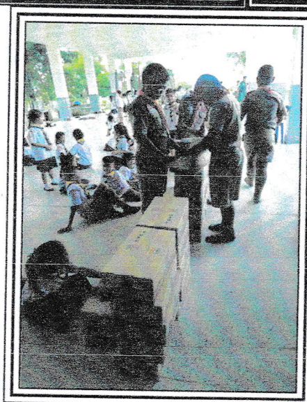
ภาพประกอบอาหารเสริม (นม) สำหรับนักเรียนในโรงเรียนเทศบาลตำบลโนนแดง ประจำภาคเรียนที่ 1 ปีการศึกษา 2562