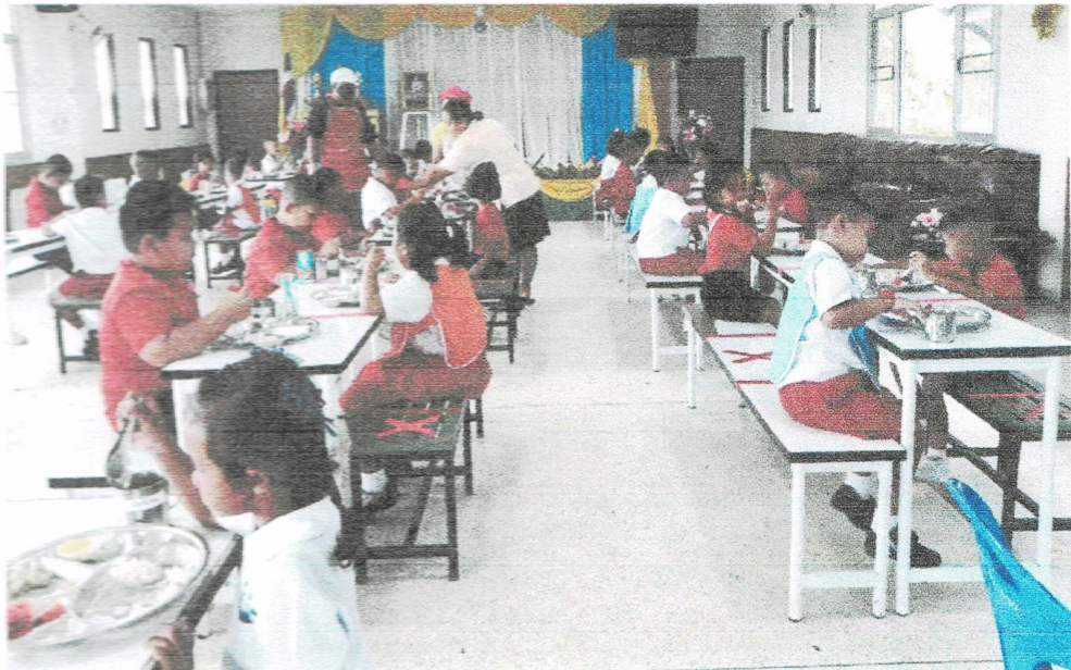
ภาพประกอบโครงการอาหารกลางวันสำหรับนักเรียนโรงเรียนอนุบาลเทศบาลตำบลโนนแดง ประจำปีงบประมาณ 2563