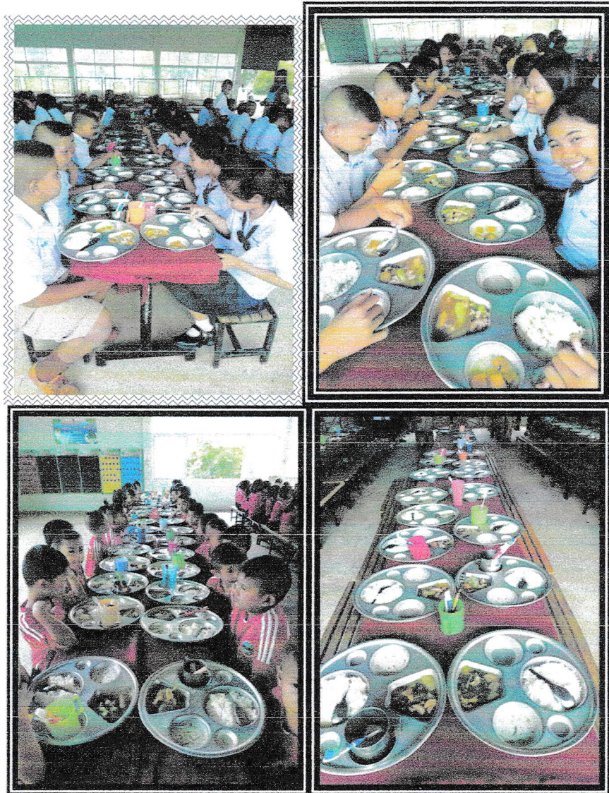
ภาพประกอบการจ้างเหมาประกอบอาหารกลางวันสำหรับนักเรียนโรงเรียนเทศบาลตำบลโนนแดง ประจำภาคเรียนที่ 1 ปีการศึกษา 2562